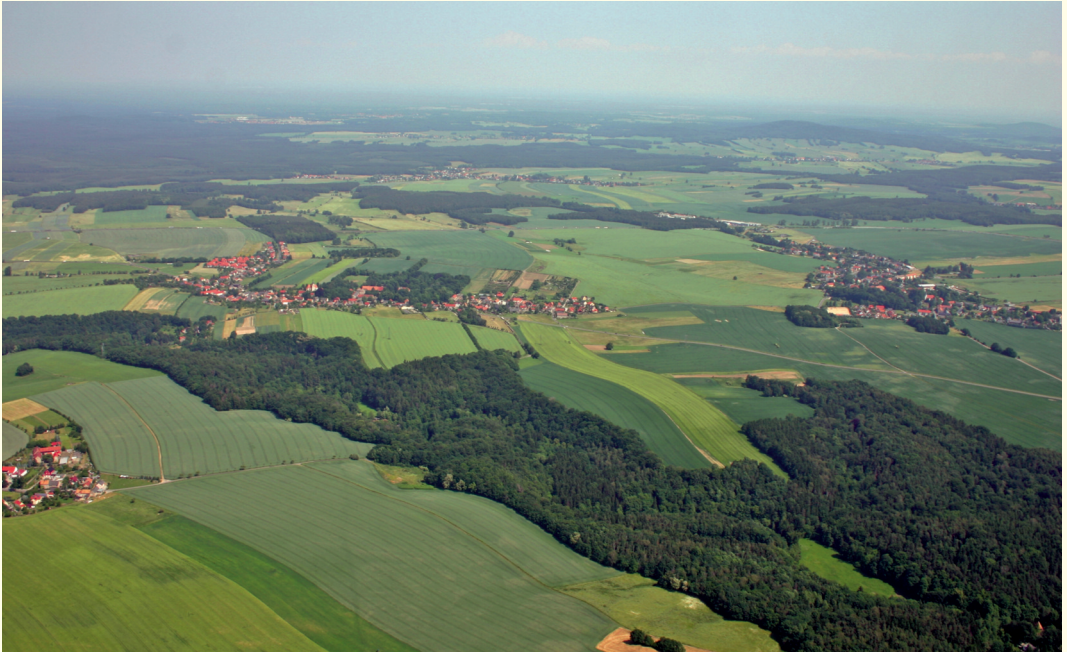
Seifersdorfer Tal von Süden.